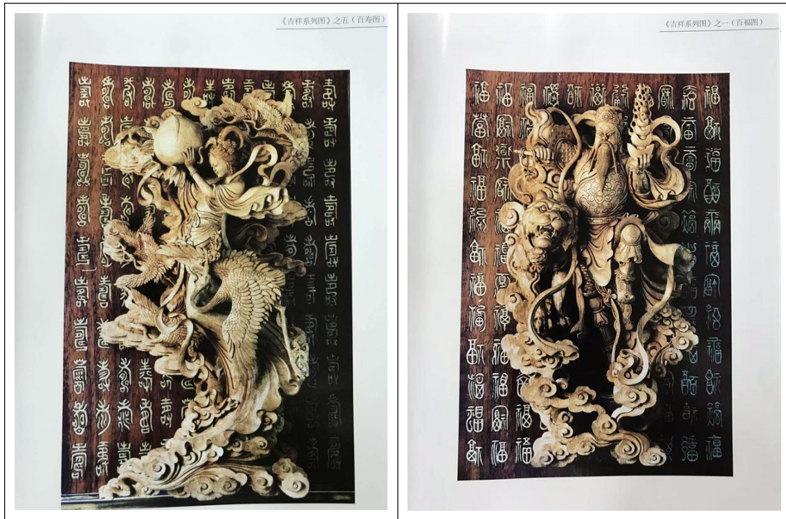
秦宪生大师部分作品展示